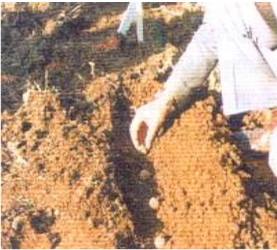
Şekil 1. Ceviz tohum ekimi

En ideal dikim derinliği 5-10 cm. arasında, en ideal dikim şekli ise, yanak kısımları yanlara, yapışma yeri (damar kısmı) toprağa gelecek şekilde dizilerek ekilmesidir. Kumlu topraklarda derin, killi ve ağır topraklarda yüzeysel dikim uygulanır.