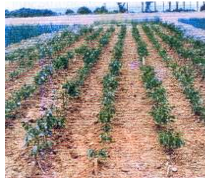
Şekil 2. Ceviz çöğürleri