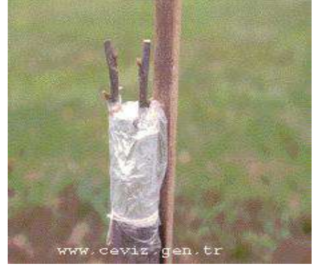
Şekil: Yarma aşı şekilleri